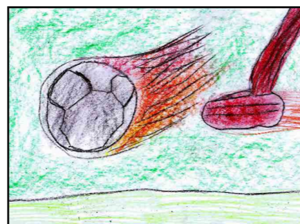
↑ Дима Розе